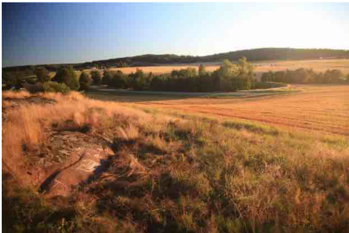
Figur 1 Bildet viser en nyfunnet helleristning i landskapet nord for Borge varde. Pukkverket og industriområdet skal ligge i kollen i bakgrunnen.